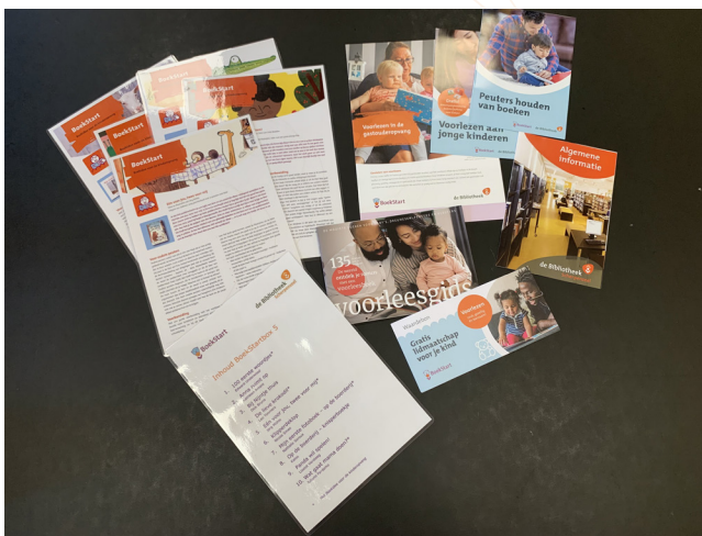
Bibliotheek Scherpenzeel: BoekStartBox